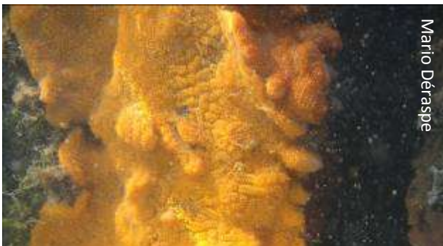
Botrylloïde violet ( Botrylloides violaceus ).

*C'est à regret que le Comité ZIP apprenait récemment la fin du Programme fédéral de partenariat sur les EEE (PPEEE).