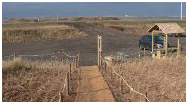
Aménagement réalisé sur le Havre-aux-Basques, du côté de la Baie de Plaisance.

Ce projet s'allie aux efforts fournis au cours de la dernière décennie visant à favoriser une conscientisation de la population locale et touristique sur la valeur des milieux naturels aux comportements qui risquent de leur nuire, parmi lesquels la création d'accès multiples et désordonnés. Celui-ci a permis l'aménagement, la restauration et la mise en valeur de deux sites au Havre-aux-Basques, sollicités pour diverses activités récréatives. Les travaux ont été réalisés de pair avec des usagers, favorisant ainsi l'harmonisation des usages entre eux et avec l'environnement. Des panneaux d'informations installés sur les deux sites aménagés permettront d'informer les utilisateurs. De plus, de nombreuses activités en milieu scolaire ainsi que des entrevues médiatiques ont été réalisées et ont assuré le rayonnement du projet auprès de la population. Le rapport final et les autres documents produits sont disponibles au bureau du Comité ZIP des Îles.