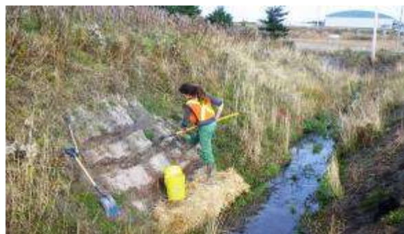
Érection de tranchées dans la paroi afin réduire le ruissellement des sédiments dans le cours d'eau.

Ce projet vise à poursuivre la démarche entreprise en 2010 afin de préserver l'intégrité des cours d'eau de l'archipel, milieux de grande valeur écologique. Il a permis d'agir directement sur des perturbations anthropiques recensées, permettant ainsi de restaurer une superficie de 796 m 2 de cours d'eau, rives et secteurs environnants. Aussi, un second volet a permis un travail de prévention, en offrant un transfert de connaissances et un soutien technique aux principaux acteurs qui œuvrent aux abords des cours d'eau. Un atelier formatif, permettant d'offrir une compréhension plus juste des cours d'eau et des façons d'amoindrir les impacts générés lors de travaux, fut élaboré à l'intention de l'équipe des travaux publics de la municipalité des Îles et offert à celle du MTQ ainsi qu'aux entrepreneurs privés. Un carnet de bonnes pratiques, adapté et concis, sera remis aux participants. Quelque cent cours d'eau sillonnent le territoire et offrent de précieux services à l'homme en plus de constituer un habitat pour bon nombre d'espèces. Le rapport final et les autres documents produits sont disponibles au bureau du Comité ZIP des Îles.