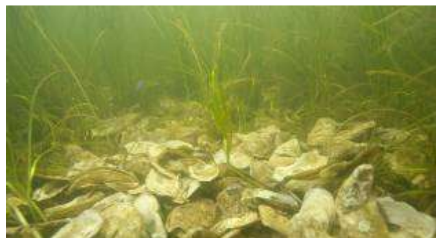
Amélioration du substrat par l'ajout de coquilles d'huîtres et de macres Atlantiques.

Dès le printemps 2011, des travaux d'entretien et de suivi ont été menés tels qu'anticipés : nettoyages des structures, retrait des prédateurs en cages, caractérisation du substrat pour la fixation des juvéniles, test de prédation en milieu naturel, etc. Les résultats étant jugés atteints par le MPO, le projet a théoriquement pris fin en juin 2011. Dans l'esprit de poursuivre la démarche entamée au début des années 2000 par le comité de gestion du bassin aux Huîtres, les structures et les organismes ont pu finalement être maintenus en place grâce à la bonne volonté et à l'appui financier de Mines Seleine. Heureux dénouement qu'est la reprise du projet par La Salicorne, permettant ainsi d'éviter le démantèlement du site. Cependant, bien que cette initiative repose sur l'implication bénévole d'usagers de l'est des Îles et qu'elle soit supportée par le Comité ZIP des Îles, des efforts devront être consacrés afin de financer certaines actions nécessaires à la pérennité de la démarche pour les prochaines années, du moins. Dans un horizon de 3 ans, il est prévu que les huîtres soient remises en milieu naturel. L'objectif ultime de ces efforts est de favoriser la pérennité de la ressource huîtres aux Îles et, ultimement de ramener une cueillette artisanale.