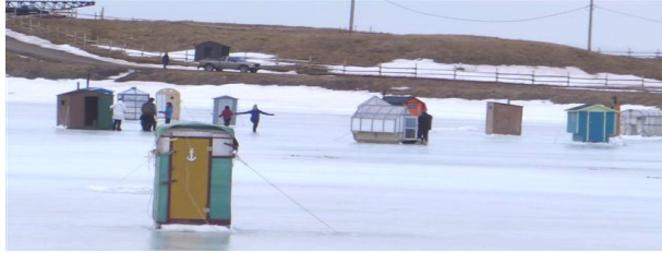
Chargée de projet : Sylvie Rousseau