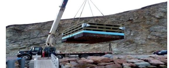
Chargé de projet : Jean-Philippe Marcoux

Les trois années de mise en œuvre du projet ont permis l'installation de bancs d'essai à six endroits sur le littoral, visant la poursuite des réflexions et l'élaboration des pistes de solutions pour faire face aux enjeux liés à l'érosion côtière. Des suivis réguliers ont permis d'obtenir des données sur l'évolution des aménagements, leur efficacité et sur le profil de plage. Les résultats obtenus sont encourageants, à certains endroits la circulation a même été freinée, favorisant ainsi la renaturalisation du site par la pousse des végétaux. L'implication des nombreux partenaires dont le MSP, le MTQ et la municipalité des Îles a permis d'accroître le travail de concertation, le partage d'informations et de mieux orienter, valider et faciliter la réalisation des interventions. Des activités de sensibilisation (porte-à-porte, sondage, capsules) ont été réalisées. Espérons qu'un suivi des installations pourra être réalisé durant la prochaine année afin de renforcer les connaissances qui permettront d'améliorer la gestion des zones côtières d'ici et d'ailleurs.